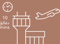
مطار البحرين الدولي Bahrain International Airport