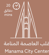
قلب العاصمة المنامة Manama City Center