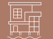
40 كم من السكن على الواجهة البحرية 40 Km of Seafront Living