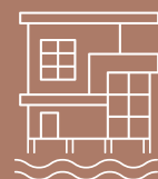
40 كم من السكن على الواجهة البحرية 40 Km of Seafront Living