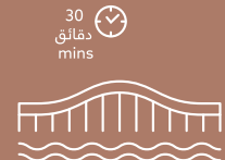
جسر الملك فهد King Fahad Causeway