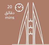
قلب العاصمة المنامة Manama City Center