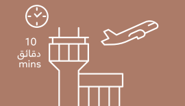
مطار البحرين الدولي Bahrain International Airport